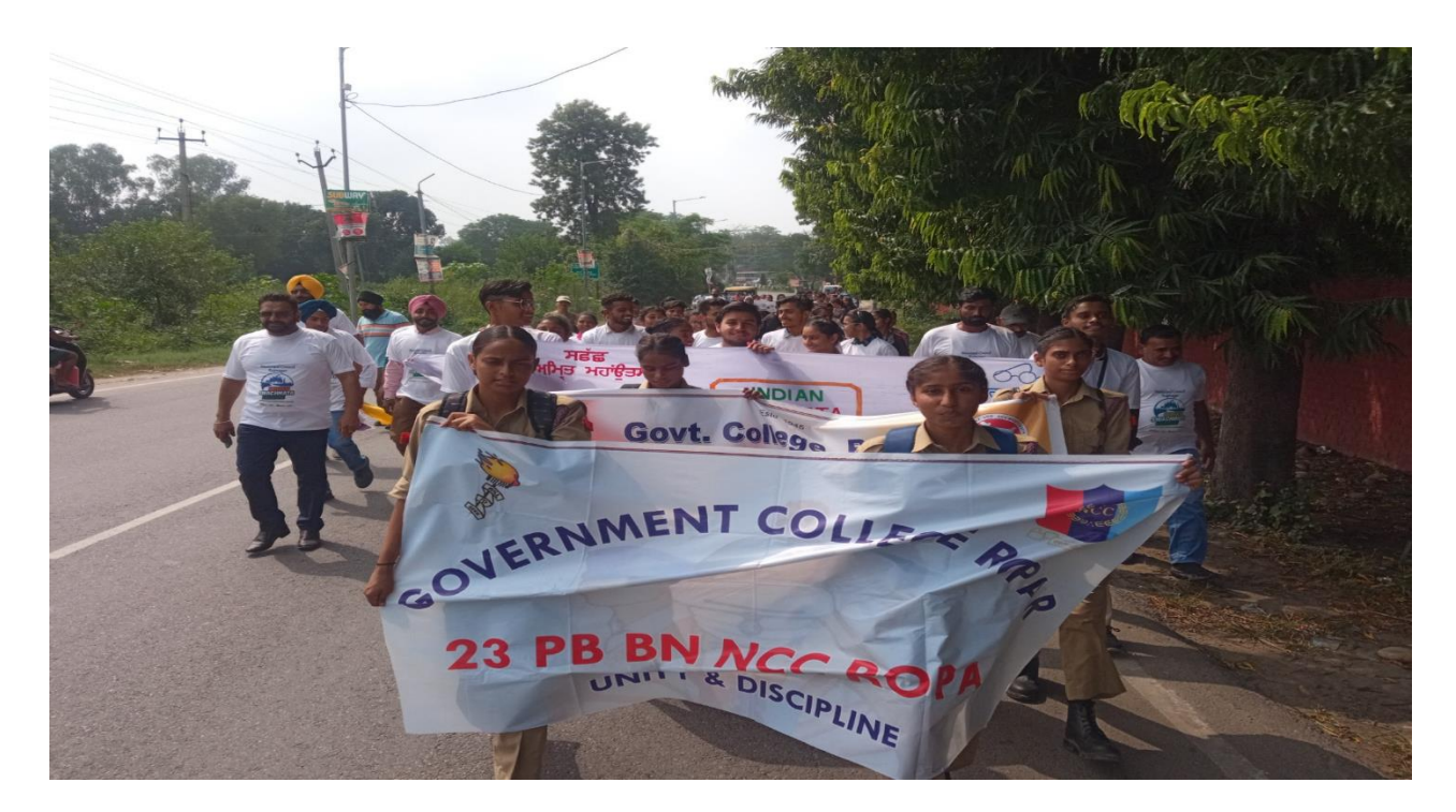
Promotion of Cleanliness League at Different key places