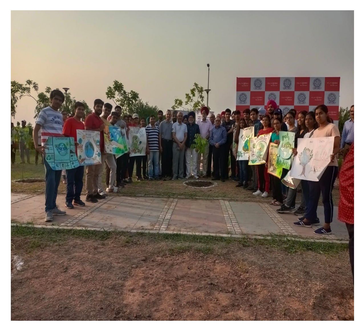
Participation of Tree Planting at IIT Ropar

On the occasion of World Environment Day Government College Ropar visited the IIT Campus of Ropar and participated in tree plantation drive to promote tree plantation under green initiatives.