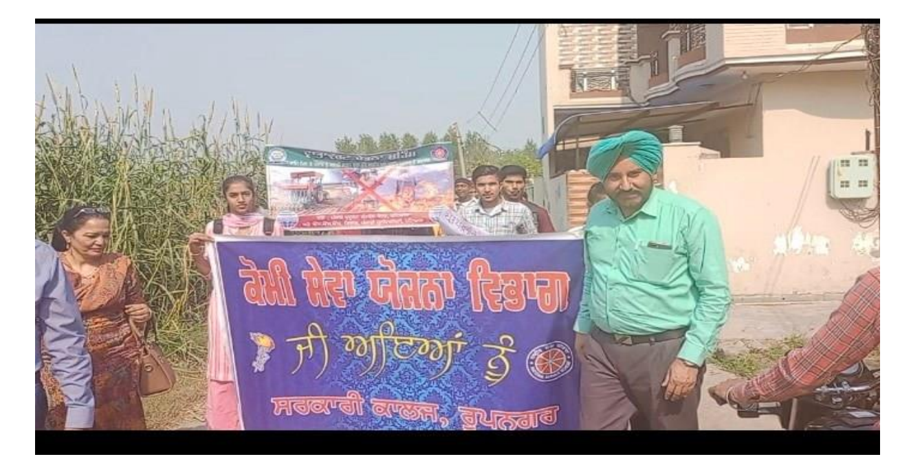
Students and staff visiting the places